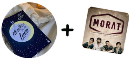
Sobre el amor y sus efectos secundarios (Morat) & Nosotros en la Luna