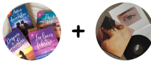
Harry Styles (Harry Styles) & Meses a tu lado (saga)