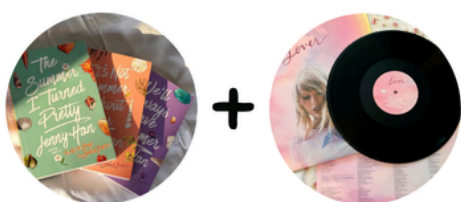
Lover (Taylor Swift) & The Summer I turned Pretty (trilogy)

La idea central de la campanya, és acompanyar cada llibre amb un vinil que s'associï amb la història que conta. Una idea visual seria la següent: